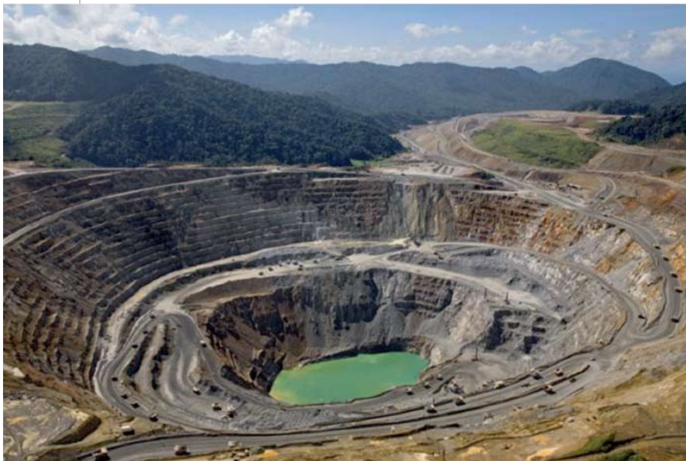
◀ AGUA DE MANANTIAL/MINERAL.

Ninguna actividad industrial tiene tantos efectos negativos ni tan significativos en todas las esferas: ambiental, social, cultural y de salud, como la minería a cielo abierto