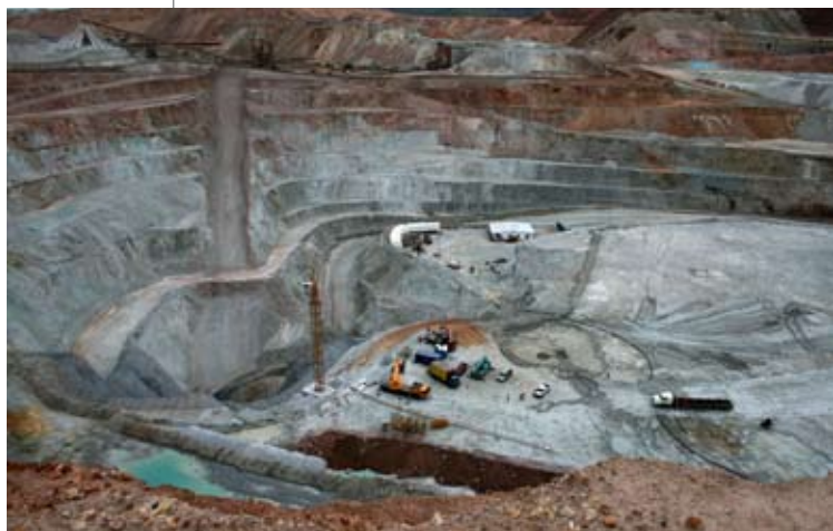
◀ MINA EN ANDACOLLO. En el noroeste neuquino, opera la empresa minera chileno-canadiense Andacollo Gold, extrae oro y cobre por el método de flotación. Los pobladores acusan a la empresa de contaminar el arroyo Huaraco (afluente del río Neuquén), 500 metros debajo de la planta de procesamiento de la minera.

cadmio, plomo, arsénico, zinc, selenio, mercurio, manganeso y boro). 11