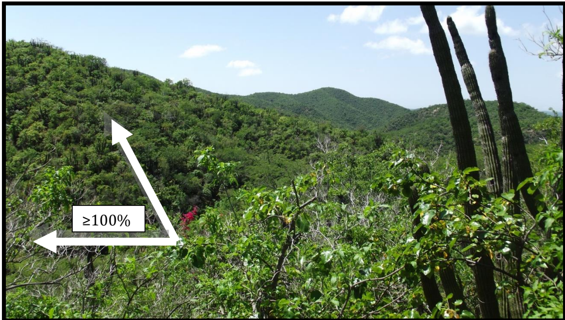
Gráfico 3: Detalle de la inter-visibilidad del terreno, se puede apreciar el “alcance” de la visibilidad del terreno, la afectación al paisaje sería visible en hasta 30km cuenca abajo, dado que se abre el valle del carrizal y la matanza cuenca abajo (toma de área de tepetatera Oeste)

Gráfico 2: Pendientes superiores al 100% en la zona de Tajo. Lo que le da una fragilidad paisajística ALTA en este atributo (toma de área de tajo).