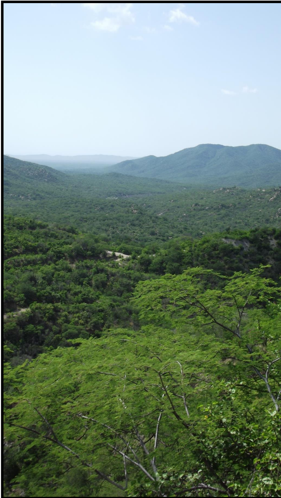
Gráfico 5: En esta imagen se puede apreciar claramente la profundidad del paisaje en cuestión (toma desde área de tajo).