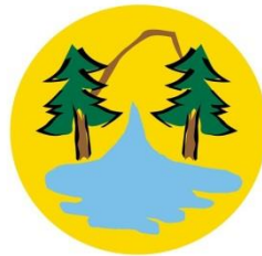
SIERRA LA LAGUNA RESERVA DE LA BIOSFERA