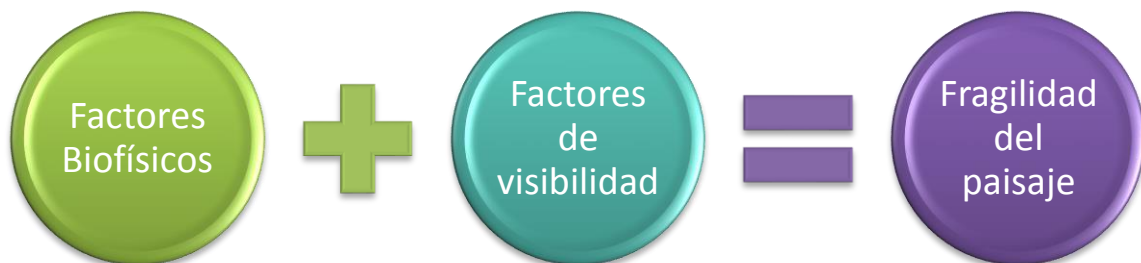
Gráfico 1: Factores de la fragilidad del paisaje (UPM, 2012)

Factores de visibilidad: Son los que hacen referencia a la accesibilidad visual del territorio.