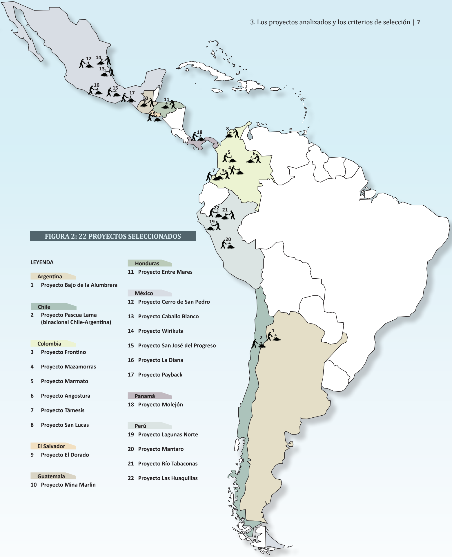
FIGURA 2: 22 PROYECTOS SELECCIONADOS