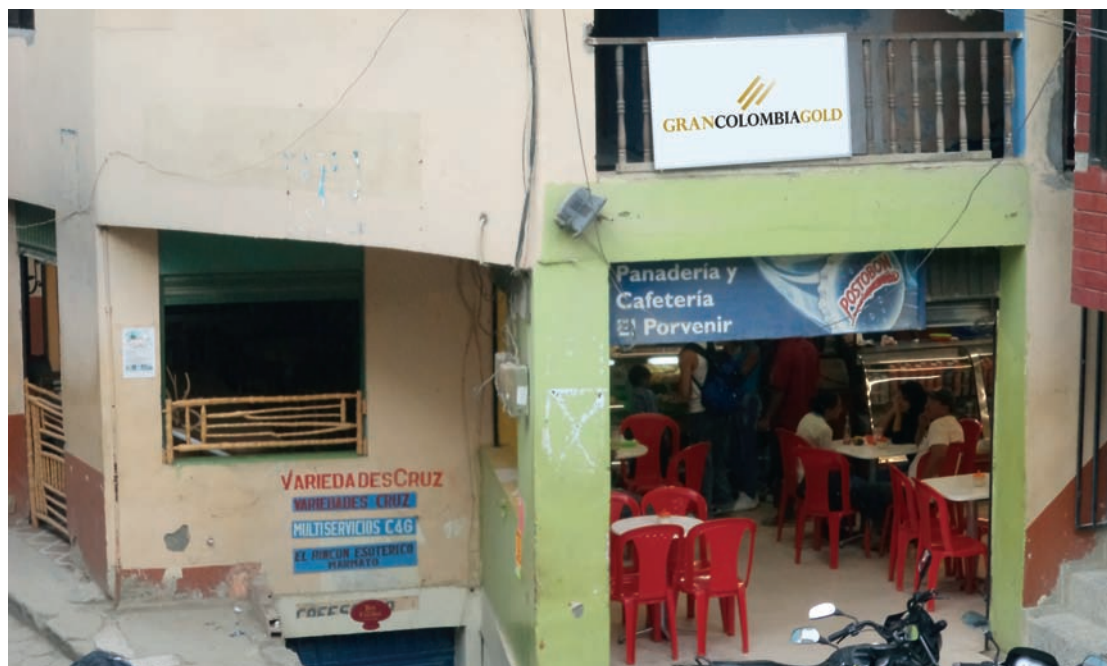
◀ Casco urbano del municipio de Marmato, Colombia, donde las actividades de Gran Colombia Gold provocarán el desplazamiento de más de 5.000 personas.

artesanal por la minería a gran escala, se han denunciado los casos de los proyectos mineros en Colombia . Por ejemplo, se ha denunciado que, en el proyecto de la mina Marmato , se quiere desalojar completamente el casco urbano, lo que implicaría la reubicación y el desplazamiento de sus lugares de origen de más de 5.000 habitantes 38 .