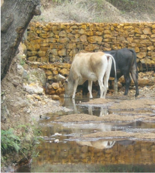
▲ Agua contaminada por las actividades de Goldcorp Inc. en el Valle de Siria, Honduras, es consumida por el ganado de la zona.