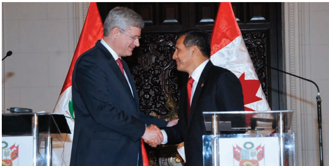
◀ Encuentro entre el Primer Ministro de Canadá, Stephen Harper, y el Presidente del Perú, Ollanta Humala, el 22 de mayo de 2013.

las denuncias por violaciones a derechos de las comunidades que habitan en las zonas en las que las minas están ubicadas 72 . Días después de la visita del Primer Ministro, el Poder Ejecutivo peruano emitió dos decretos supremos para facilitar las inversiones, flexibilizando aún más los marcos legales vigentes para las industrias extractivas, en especial la minera. Hace algunos años, el convenio bilateral PERCAN entre Canadá y Perú, brindó asesoría al segundo país para implementar normativa en el sector minero. Por medio de PERCAN se estableció el marco para la adopción de las normas que actualmente tiene el país en materia ambiental y de participación ciudadana en el sector minero.