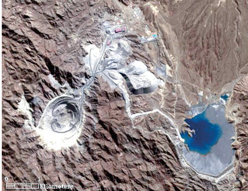
▲ Mina Bajo de la Alumbra en Argentina.

25 de septiembre de 2013, tras comprobarse contaminación hídrica subterránea en los glaciares Toro 1, Toro 2 y Esperanza 30 . Dicha información ha sido corroborada por el Servicio Nacional de Geología y Minería y el Sistema de Evaluación Ambiental, el cual emitió resolución en octubre de 2012 ordenando la suspensión de las actividades de perforación por parte de Barrick Gold Corp 31 .