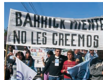
▲ Congregación de Hermanas del Buen Samaritano en una manifestación en Vallenar, región de Atacama, contra dádivas ofrecidas por la empresa Barrick Gold.