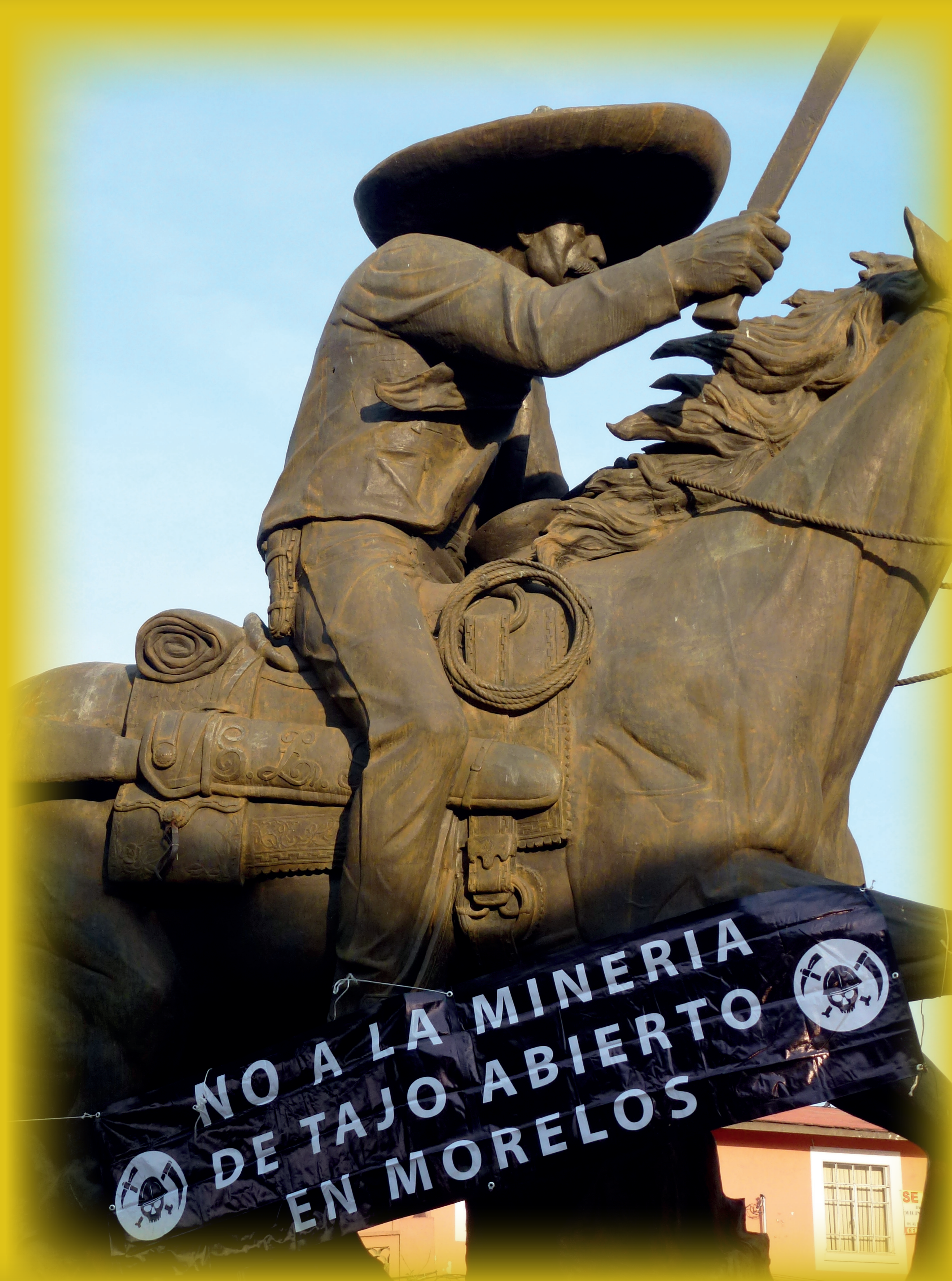
Inicio de la “Caravana por la Vida”, Cuernavaca, abril de 2013

LA INICIATIVA MEGAMINERA MOTIVÓ una movilización social en el estado, que recabó más de 16,000 firmas en oposición, entregadas en la embajada de Canadá sin respuesta formal alguna. La presión de la sociedad civil, con la participación de diversas comunidades afectables, de ambientalistas y trabajadores académicos, así como el apoyo de algunas instituciones, de otros movimientos en el país, y del gobierno estatal, que se manifestó en contra de la mina, resultó en el rechazo de la manifestación de impacto ambiental presentada para iniciar la explotación en enero de 2014.