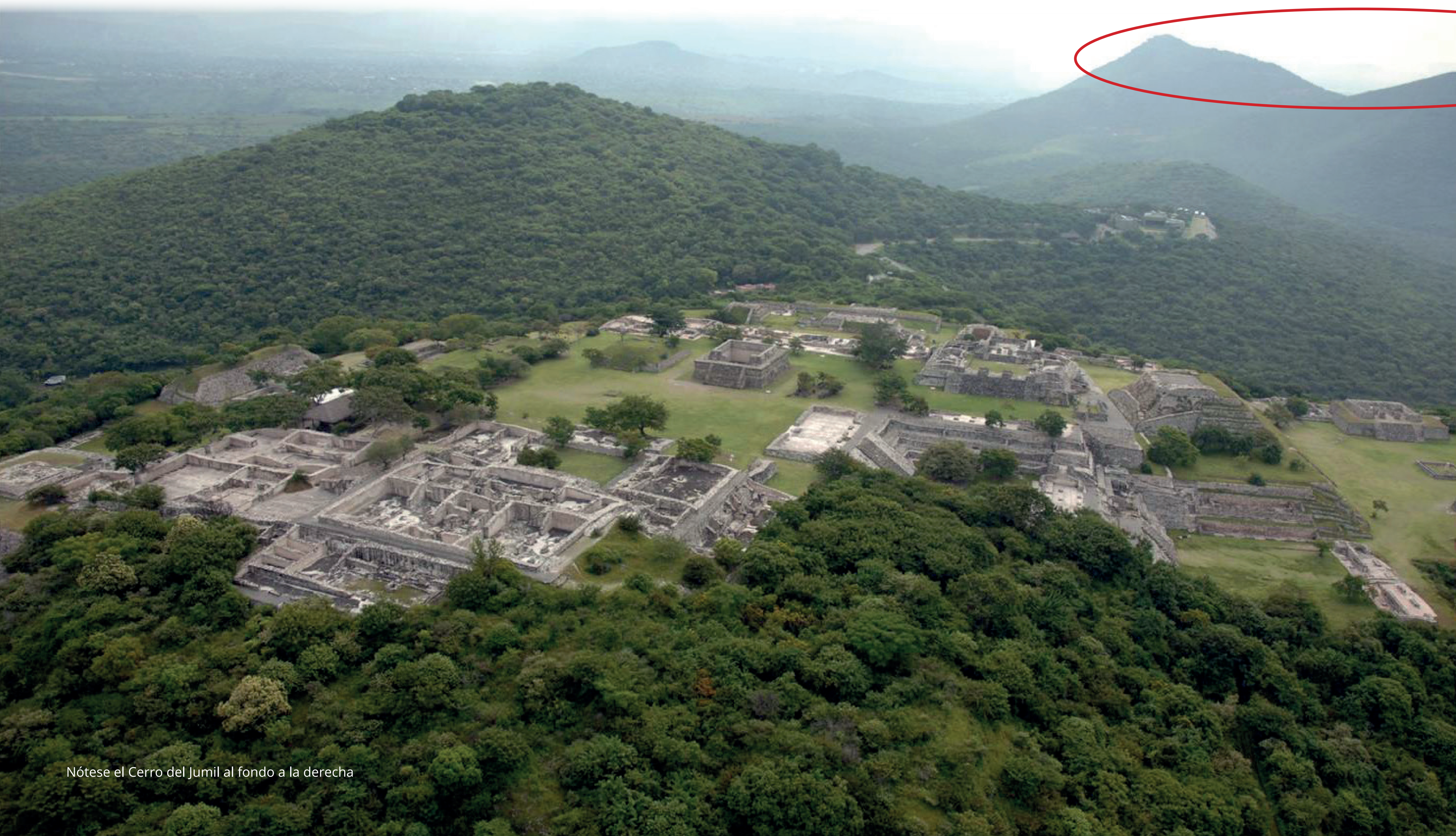
Nótese el Cerro del Jumil al fondo a la derecha

EN 2009, el subsuelo de la zona arqueológica de Xochicalco en Morelos, declarada patrimonio cultural de la humanidad en 1994, fue otorgado en concesión a la empresa canadiense Esperanza Silver, de Vancouver, por la Secretaría de Economía. Dicha concesión por 278 hectáreas, denominada “Esperanza V” y cuyo título es el número 234,011, vence el 14 de mayo de 2059.